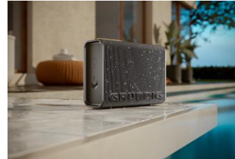
Der Grundig Jam 2 ist dank Schutzklasse IP67 optimal für den Pool.

Eschborn, 28. Juni 2024 – Grundig stellt seine neuesten portablen Audio-Innovationen vor: die Lautsprecher Xplore Black, Jam 2, SOLO 2 und Party-Hit Max. Diese Modelle verbinden modernste Technologie mit herausragendem Design und bieten Musikliebhaber:innen alles, was sie für unbegrenzten Soundgenuss benötigen – perfekt für Festivals, Poolpartys und entspannte Sommerabende im Park.